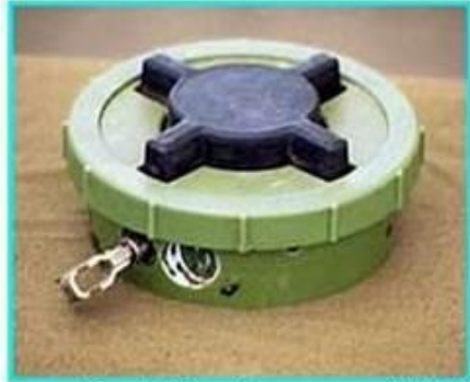
Рис.1 Общий вид мины ПМН-2