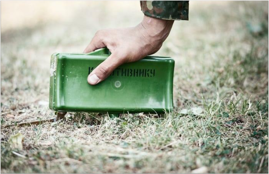
Мина в боевом положении